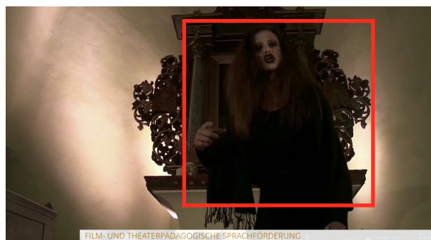
Amerikanische (Einzelne Personen die von den Knien bis zum Kopf zu sehen sind)