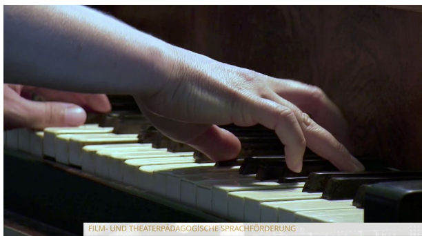
Abbildung 4 :

Drei Fotos in der Detail Einstellung siehe (Abb.4).